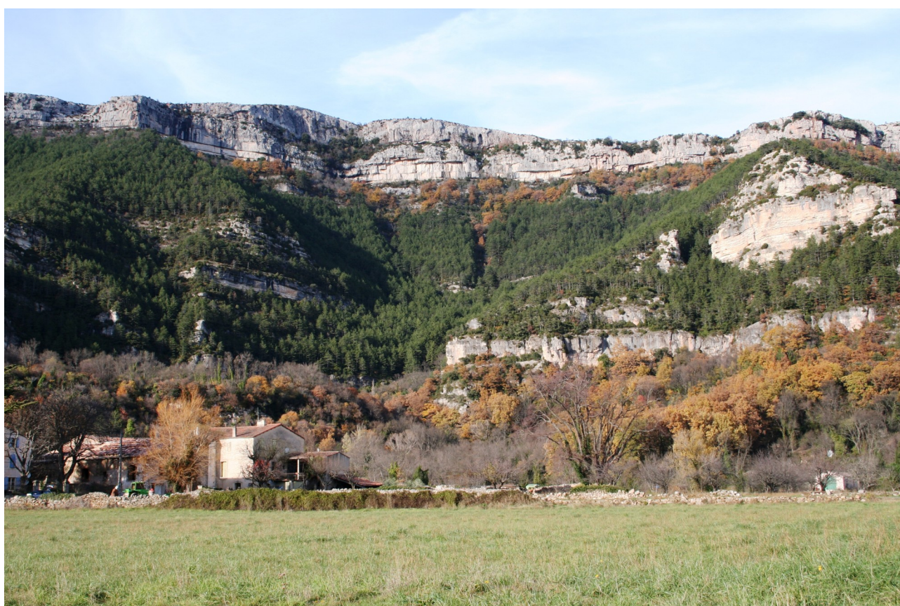
Cirque du Bout du Monde, Saint Etienne de Gourgas