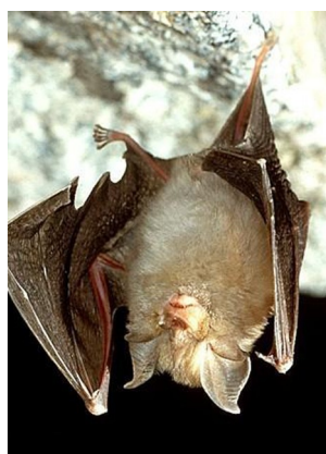
1303 Petit Rhinolophe