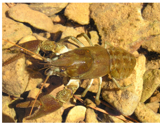
1092 Écrevisses à pattes blanches

Les enjeux portent sur la conservation des habitats des cours d'eau (fonctionnement et qualité des cours d'eau), des milieux ouverts, des surfaces boisées et des habitats rocheux.