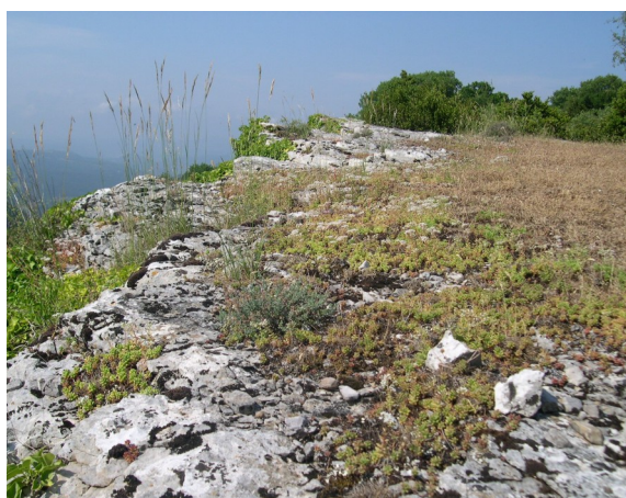
*6110 Pelouses à Orpins