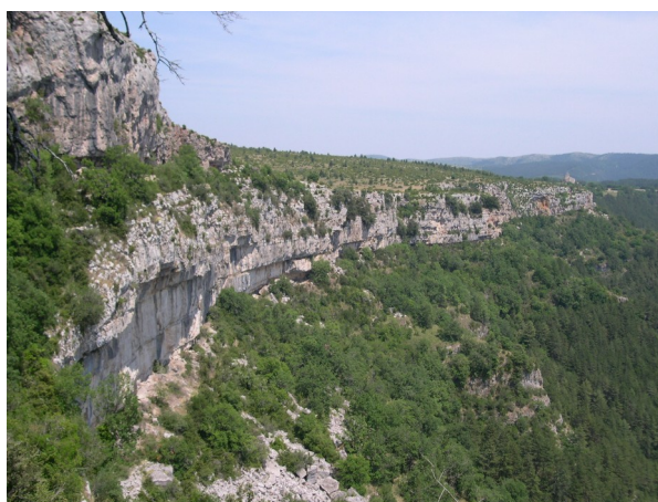
8210 Falaises calcaires