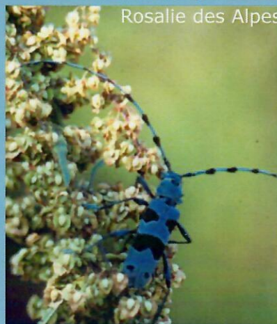
Rosalie des Alpes