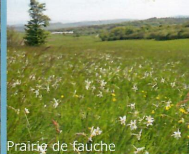
Prairie de fauche

Pendant, si le climat, la roche et les bouleversements géologiques ont contribué à sa formation, c'est l'Homme qui, de la préhistoire à nos jours, a façonné le paysage caussenard.